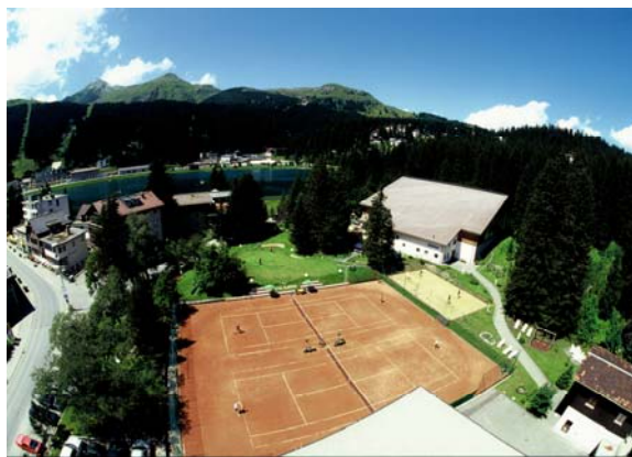
Valsana-Hallenbad, Tennishalle, Tennisplätze, Beach-Volley, Putting Green ...