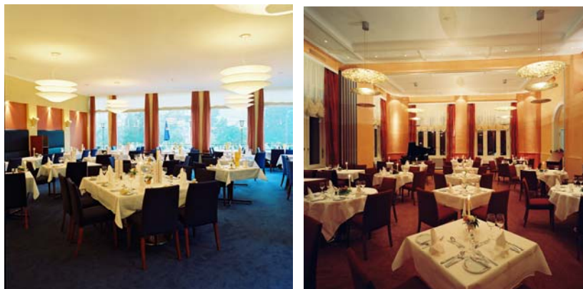
„Carmenna“ und „Schiesshorn“ Festsäle für flexiblen Einsatz

Unsere Festsäle stehen für Ihren schönsten Tag bereit (unterteilbar in drei Räumlichkeiten) – die Möglichkeiten sind offen und vielfältig einsetzbar.